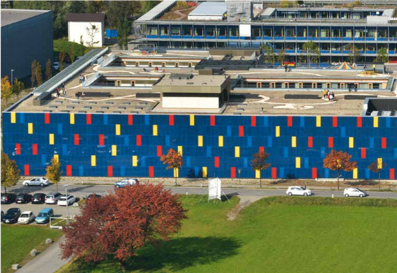
780 m 2 Photovoltaikzellen sind an der Außenfassade des OMICRON-Gebäudes in Klaus angebracht.

Es ist Mai 2015, der ideale Zeitpunkt, um das Verhalten der OMICRON-eigenen Photovoltaik(PV)-Anlage genauer unter die Lupe zu nehmen. Dabei interessierte Ines Halbritter, Software Project Manager im Bereich Power Utility Communication, weniger die Energieabgabe des Systems als vielmehr, wie sich die Anlage auf das interne und externe Energieverteilungsnetzwerk auswirkt. Je nach gerade vorherrschender Witterungsbedingung und Tageszeit liefern regenerative Erzeugungsanlagen bekanntlich eine sehr variable Energiemenge.